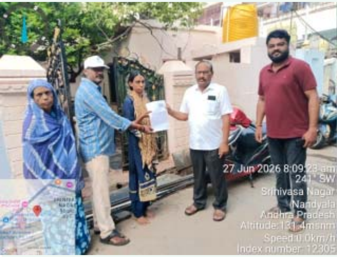
27 Jun 2026 8:09:23 am 24.1 SW Srinivasa Nagar Nandyala Andhra Pradesh Altitude: 131.4m asl Speed: 0.0km/h Index number: 12305

ఎన్నికల సంఘం చర్యలు తప్పకుండా : కమిషనర్ బి. శేషన్న--