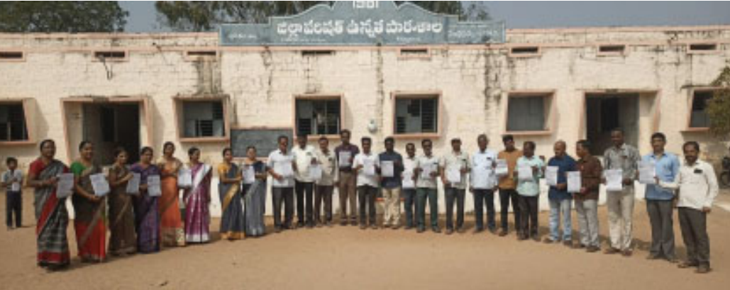
కరపత్రాలను విడుదల చేస్తున్న ఉపాధ్యాయుని ఉపాధ్యాయులు..