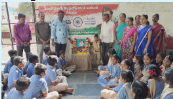
చిత్రపటానికి పూలమాలవేసి నివాళులర్పిస్తున్న దృశ్యం