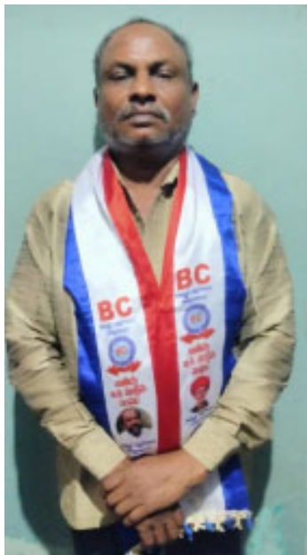
విభారే న్యూస్ డోస్ మా ప్రతినిధి : - జనవరి 17 ఆంధ్రప్రదేశ్ ఒక జిల్లాకు ఆయన పేరు పెట్టాలి భారతదేశంలోని చరిత్ర కలిగిన ఒక గొప్ప మహా చక్రవర్తి శ్రీకృష్ణదేవరాయలు ప్రపంచ