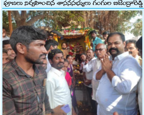
ఉత్సవ పల్లకి కి పూజలు చేస్తున్న దృశ్యం