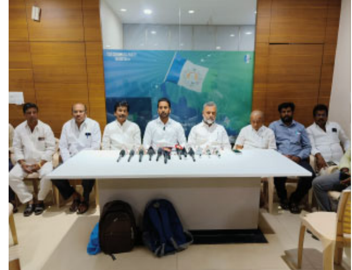
విభారే న్యూస్ నంద్యాల మా ప్రతినిధి జనవరి -మహానేత బదుగు, బలహీన వర్గాల ఆశాజ్యోతి, రాజ్యాంగ నిర్మాణత డా.బాబా సాహెబ్ అంబేద్కర్ అవిష్కరణ, స్మృతివేగం ప్రారంభోత్సవాన్ని విజయవంతం