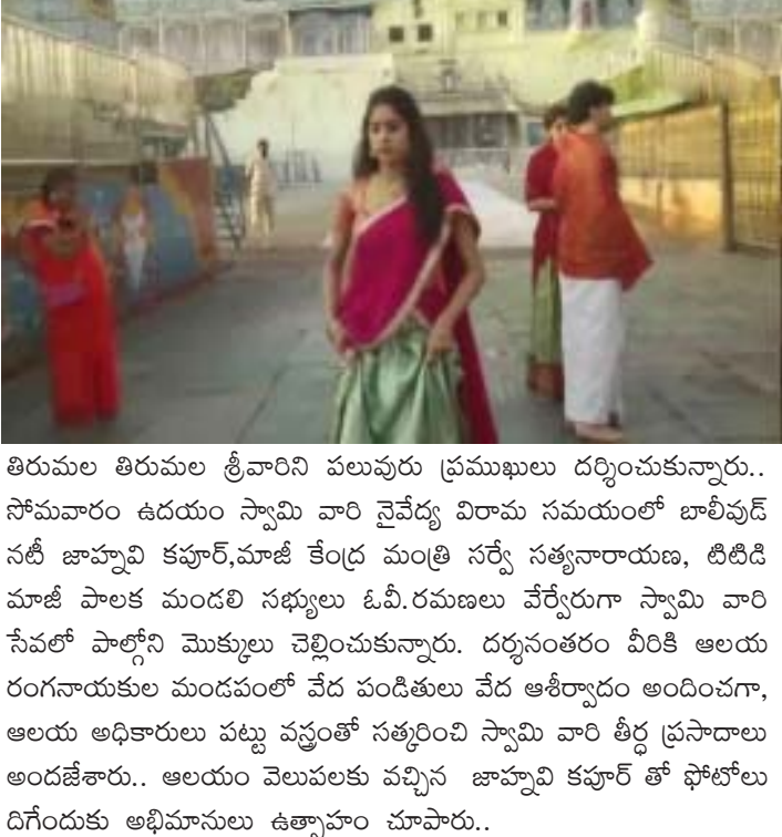
తిరుమల తిరుమల శ్రీవారిని పలువేడు ప్రముఖులు దర్శించుకున్నారు..