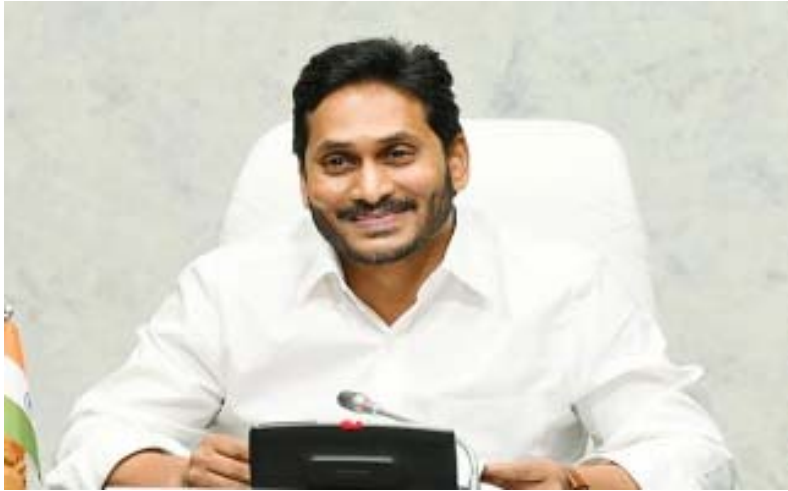
పులివెందుల/కడప: జిల్లాలో ఈనెల 7,8 తేదీలలో ముఖ్యమంత్రి వైఎస్ జగన్మోహన్ రెడ్డి పర్యటించనున్నారు. ఈ మేరకు అధికార యంత్రాంగం షెడ్యూల్ ఖరారు చేసింది. 7వ తేదీ ఉదయం 9 గంటలకు ముఖ్యమంత్రి తాడేపల్లిలోని తన నివాసం నుంచి బయలుదేరి 9.20 గంటలకు గన్నవరం విమానాశ్రయం చేరుకుంటారు. అక్కడ 9.30కి బయలుదేరి 10.20 గంటలకు కడప విమానాశ్రయానికి చేరుకుంటారు. అక్కడి నుంచి 10.30కి ప్రత్యేక హెలికాప్టర్లో బయలుదేరి 10.55కు పులివెందులలోని బాకరాపురం

రిజిస్ట్రార్లు (1), ఎస్సీ సంక్షేమ అధికారి (1), డి.పీ.ఓ (1), డి.పి.ఓ (1), గ్రేడ్-2 మున్సిపల్ కమిషనర్లు (1), వైద్యారోగ్య పరిపాలనలో అడ్మినిస్ట్రేటివ్ అధికారులు (6), అసిస్టెంట్ ఆఫీసర్ (6) తదితర పోస్టులున్నాయి. నాలుగేండ్ల సుదీర్ఘ విరామం తర్వాత గ్రూప్ 1 ఫలితాలు విడుదల చేస్తున్నట్లు ఏపీపీఎస్సీ చైర్మన్ గౌతమ్ నవాగ్ తెలిపారు. 167 పోస్టుల భర్తీకి లక్షన్నర మంది హాజరుకాగా, 325 మంది ఇంటర్వ్యూ వరకు వచ్చినట్లు చెప్పారు. కోర్టు తీర్పునకు లోబడి ఈ ఫలితాలు వర్తిస్తాయని పేర్కొన్నారు. డిజిటల్ వద్దతిలో వ్యాఖ్యాయోజన జరిపామన్నారు. వచ్చే నెలలో గ్రూప్ 1, 2 నోటిఫికేషన్లు జారీ చేస్తామని వెల్లడించారు. మూల్యాంకనం అంత పూర్తి పారదర్శకంగా జరిగినందున అభ్యర్థులు ఎవరూ ఆందోళన చెందాల్సిన అవసరం లేదని స్పష్టం చేశారు.