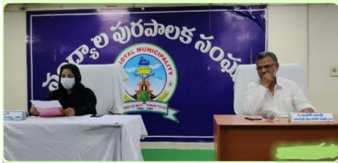
మోటింగ్ లో పాల్గొన్న జిల్లా వస్త్రీ అంతే గతంలో జరిగిన సంఘటనలు భువనావృత్తం కాకుండా పోతున్నాయి చూడాలని పలువురు కోరుతున్నారు