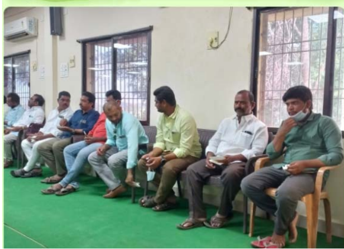
నంద్యాల డిసెంబర్ 31, (విభాగం) :- నంద్యాల పట్టణంలో శుక్రవారం నాడు మున్సిపల్ కౌన్సిల్ సాధారణ సమావేశం జరిగింది. ఈ సమావేశంలో