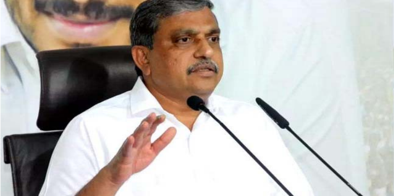
రాష్ట్రంలో 12 మున్సిపాలిటీలు, ఒక కార్పొరేషన్లో ఎన్నికలు జరుగుతున్నాయి.. ప్రభుత్వంపై ప్రజలకు ఉన్న అభిప్రాయం ఇప్పటికే తెలిసిపోయిందని వైఎస్సార్ సీపీ ప్రధాన

ప్రభుత్వాలు నిరక్షణం చేశాయి. కనీస సౌకర్యాలకు కూడా వారు నోచుకోలేదు. గత ప్రభుత్వ (కాంగ్రెస్) హయాంలో వెనుకబడిన ప్రాంతాలకు గానే మిగిలిపోయిన 100 జిల్లాల్లో ఇప్పుడు అభివృద్ధి పట్టాలెక్కుతోంది" అని ప్రధాని ఈ సందర్భంగా అన్నారు. స్వాతంత్ర్యం వచ్చిన తర్వాత జరుపుతున్న తొలి జన్ జాతీయ గారవ్ దివస్ ఇదని చెప్పారు. స్వాతంత్ర్య పోరాటం, జాతి నిర్మాణంలో గిరిజన కళలు, సంస్కృతి, వారి సేవలు ప్రశంసనీయమని. గోండులు రాణి దుర్గవతి సాహసం కానీ, రాణి కమలాపతి త్యాగం కానీ దేశం ఎప్పుడీ మరిచిపోదని అన్నారు. సాహసవంతులైన భిల్ల జాతి గిరిజనులు లేకుండా వీర మహారాజా ప్రతాప్ పోరాటం ఊహించడం కూడా సాధ్యం కాదని అన్నారు. గత ప్రభుత్వాలు గిరిజన ప్రముఖులను, వారి సేవలను నిరక్షణం చేసిందని, గిరిజన సమాజం సేవలను దేశానికి చెప్పలేదని, పరిమిత సమాచారం మాత్రమే ఇచ్చిందని విమర్శించారు. జన్ జాతీయ గారవ్ దివస్ మహాసమ్మేళనంలో మధ్యప్రదేశ్ ముఖ్యమంత్రి శివరాజ్ సింగ్ చౌహాన్ పాల్గొన్నారు. పెద్దపత్తున ప్రజాసేవకు హాజరయ్యారు.