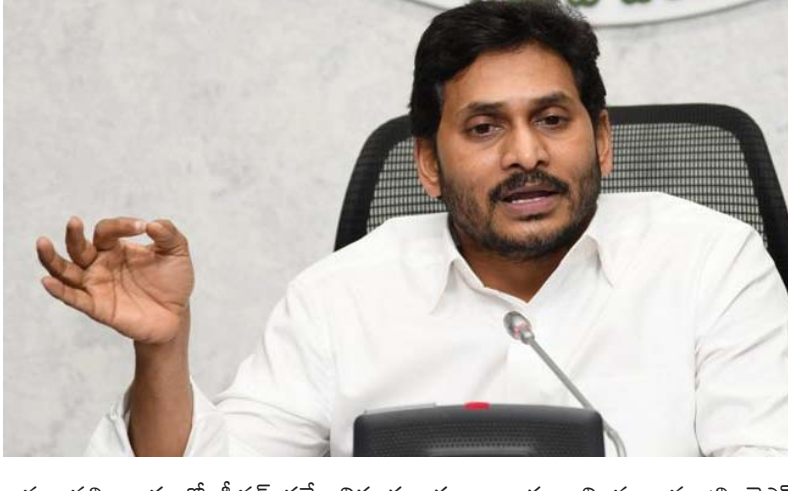
అమరావతి: రాష్ట్రంలో ఫీవర్ సర్వే నిరంతరాయంగా జరగాలని ముఖ్యమంత్రి వైఎస్ జగన్మోహన్ రెడ్డి తెలిపారు. జ్యూరం లక్షణాలుంటే వెంటనే పరీక్షలు చేసి, వైద్య

న్యూఢిల్లీ : దేశవ్యాప్తంగా జీఎస్టీ వసూళ్లు జూన్ నెలలో 92,849 కోట్లుగా ఉందని కేంద్ర ఆర్థిక శాఖ చెప్పింది. ఈ ఏడాది జూన్ 5వ తేదీ నుంచి జూలై 5వ వరకు ఆ మొత్తం జీఎస్టీ వసూళ్లు ప్రభుత్వం వెల్లడించింది. వాస్తవానికి ఇటీవల ప్రతి నెల లక్ష కోట్లకు పైగా జీఎస్టీ వసూళ్లు అయ్యాయి. క ఆనీ ఇటీవల పన్నుదారులకు కొన్ని రాయితీలు ప్రకటించడం వల్ల ఈ నెలలో జీఎస్టీ వసూళ్లు తగ్గినట్లు తెలుస్తోంది. కరోనా