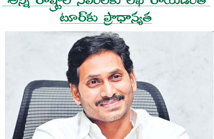
రాసినప్పటికీ... తేరక ముఖ్యమంత్రి పినరయ విజయన్ కు రాసిన లేఖ మాత్రం బయటికి వచ్చింది.

అమరావతి: ప్రకృతి దేవుడు మనకు అందించిన గొప్ప వరం.. సహజవనరులే మన సంపద అన్నారు ముఖ్యమంత్రి వైఎస్ జగన్మోహన్ రెడ్డి. ప్రపంచ పర్యావరణ దినోత్సవం సందర్భంగా సీఎం జగన్ ఢిల్లీ చేశారు. "ప్రకృతి.. దేవుడు మనకు అందించిన గొప్పవరం. సహజవనరులే మన సంపద. మొక్కలు పెంచి కాలుష్యాన్ని నియంత్రిస్తూ, ప్లాస్టిక్ వాడకాన్ని తగ్గిస్తూ.. వ ర్యావరణ నమోతాల్ని కాపాడుకోవాలి. భావితరాలకు వచ్చిన భూమిని పదిలంగా అందించాలి.. ఇది మనందరి బాధ్యత"అంటూ సీఎం జగన్ ఢిల్లీ చేశారు.